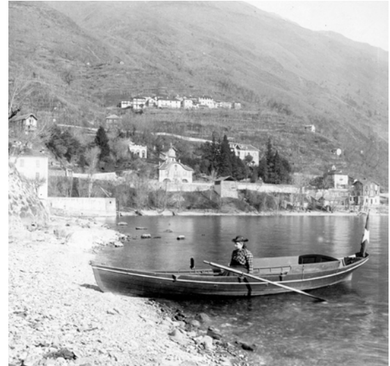
Else Hildebrand Brissago anfang des 20. Jahrhunderts